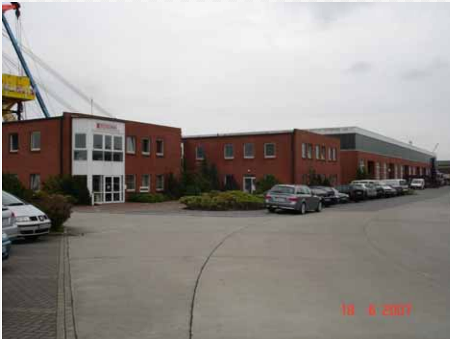
ROSOMA Bürogebäude Sozialgebäude Produktionsgebäude